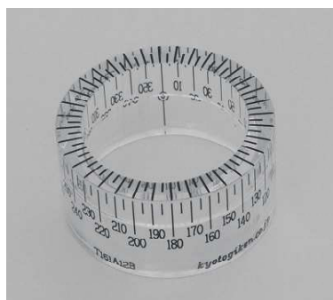
< T161A12B >