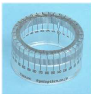
< T161A13C >