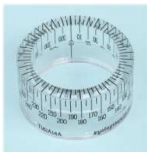
< T161A14A >