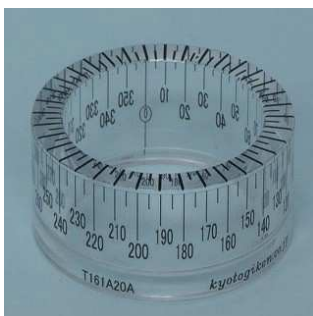
< T161A20A >